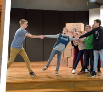
Zofingen: Jugendliche üben für das Theater in der Kinderwoche «Ferie deheim».