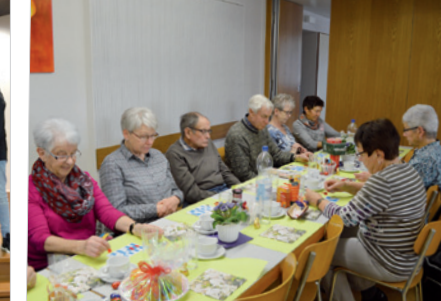
Vordemwald: Senioren versuchen ihr Glück beim Lottospielen.