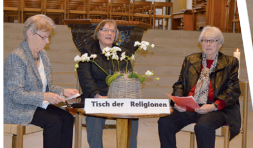
Zofingen: «Vertreterinnen verschiedener Religionen» diskutieren am Theatergottesdienst.