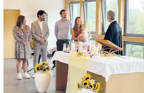
Gottesdienst mit Taufen im Zentrum Eichhölzli