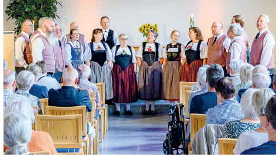
Festgottesdienst zum 75-jährigen Jubiläum der Kirche Vordemwald mit dem Jodlerklub Edelweiss Zofingen