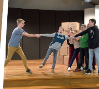
Zofingen: Jugendliche üben für das Theater in der Kinderwoche «Ferie deheim».