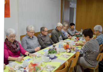
Vordemwald: Senioren versuchen ihr Glück beim Lottospielen.